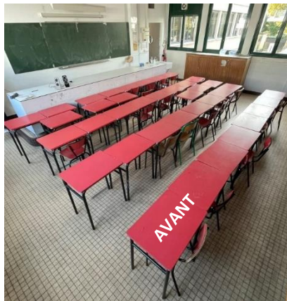
RENOVATION DES LABOS DE SVT