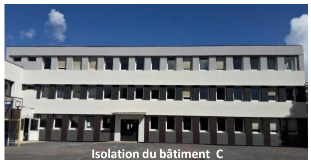
Isolation du bâtiment C